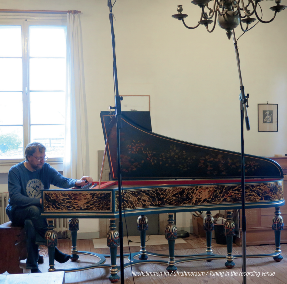
Nachstimmen im Aufnahmerraum / Tuning in the recording venue